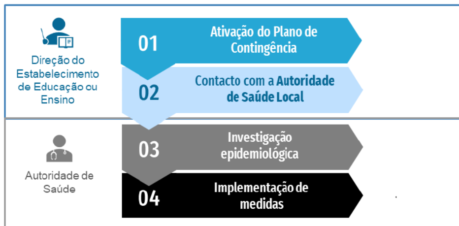
Fluxograma de atuação perante um caso confirmado de COVID-19 em contexto escolar

Se o caso confirmado tiver sido identificado fora do estabelecimento de educação ou ensino, devem ser seguidos os seguintes passos: